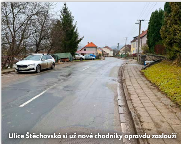
Ulice Štěchovská si už nové chodníky opravdu zaslouží