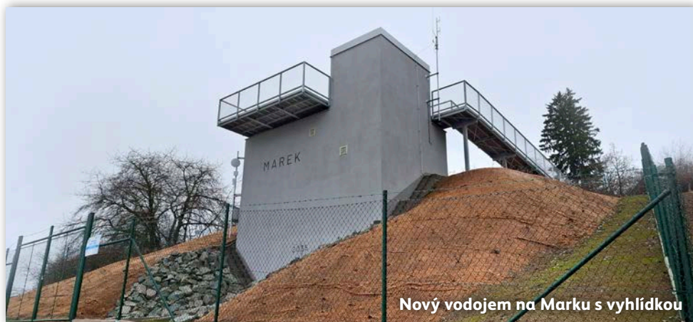
Nový vodojem na Marku s vyhlídkou