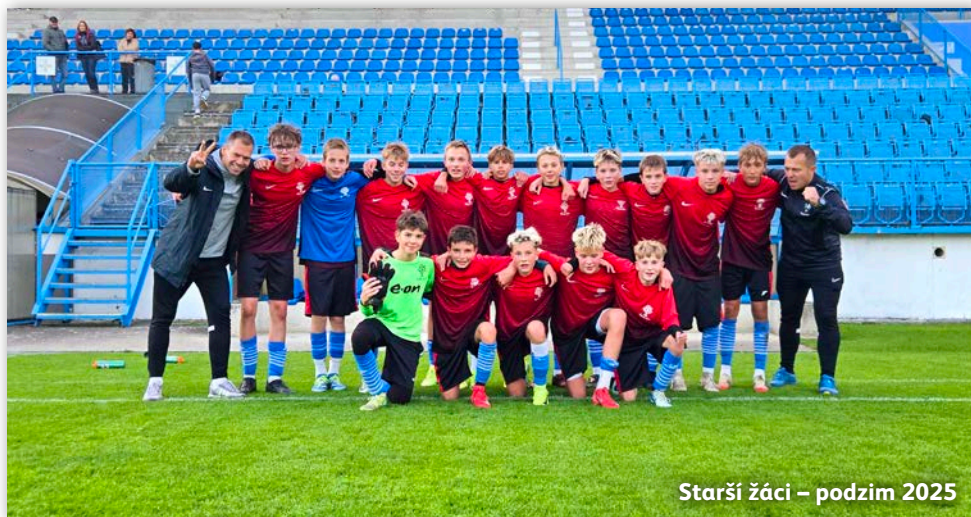
Starší žáci – podzim 2025

chtěli být dobře připraveni. S letní přípravou jsme tak začali ve druhé polovině července. Vlivem dovolených a dalších prázdninových aktivit se nezapojili všichni hráči hned, ale postupně do tréninkového procesu naskakovali.