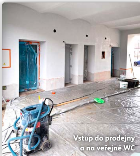
Vstup do prodejny a na veřejné WC