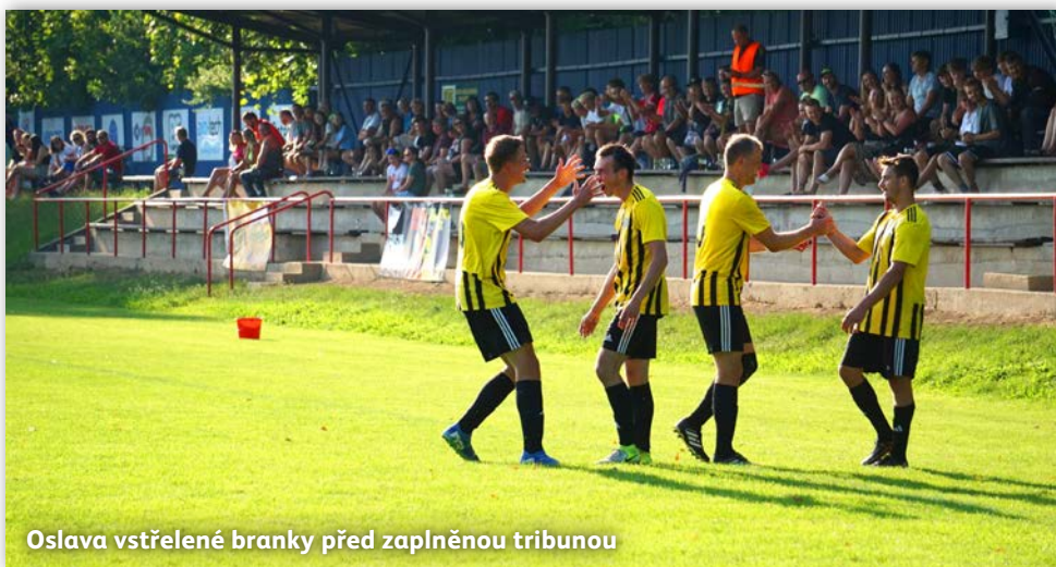
Oslava vstřelené branky před zaplněnou tribunou

Bohužel v pozdějších zápasech se od nás štěstí odklonilo a chyběl nám “po- slední kousek skládačky”, abychom vý- sledek dotáhli do plného zisku. I tak jsem ale spokojen, jelikož soutěž jako taková šla kvalitativně hodně nahoru a s ní jsme rostli i my.