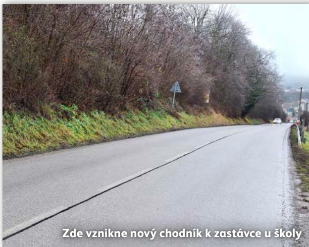
Zde vznikne nový chodník k zastávce u školy

chodník od autobusové zastávky „Na Jáně“, vedený ve svahu podél silnice, který umožní přístup ze spodní Oulehly. Chodník výrazně zvýší bezpečnost chodců, kteří jsou dnes nuceni chodit po krajnici vozovky a ohrožují tak nejen sebe, ale i všechny účastníky silničního provozu. Nesmím zapomenout ani na adaptaci prostor bývalé pobočky spořitelny na komunitní centrum, které rozšíří možnosti setkávání a aktivit pro všechny generace. I v příštím roce nás tedy čeká spousta práce. A já věřím, že společně zvládneme posunout Lysice zase o kus dál.