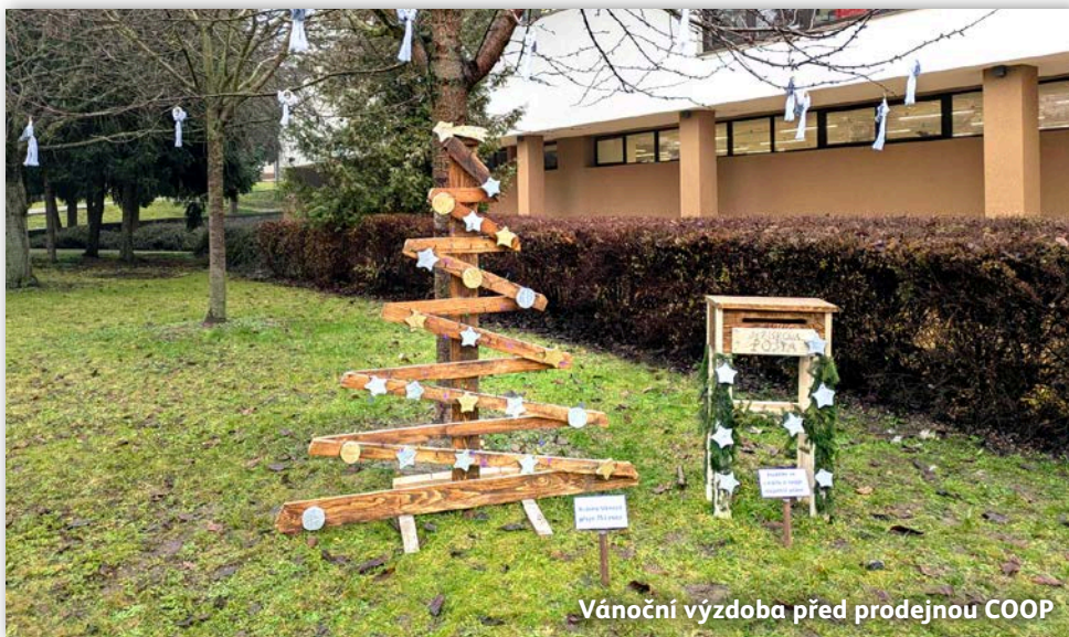
Vánoční výzdoba před prodejnou COOP

Žákovský parlament zaměřil všechnu svou pozornost na přípravu akce Lysičáci mají talent. Jedná se o talentovou soutěž pro žáky školy. V loňském roce se tato akce vrátila po mnoha letech na předvánoční program školy a měla velký úspěch. Letos se do zorganizování parlament pustil znovu. Předposlední školní den roku 2025 se soutěžící mezi sebou utkají a budeme znát vítěze. Akce se připravuje zhruba měsíc, volí se porota, probíhá konkurz, tisknou se plakáty, připravují se diplomy a ceny, chystají se hudební podklady, schraňují se pomůcky pro soutěžící, zkouší se ozvučení tělocvičny. Příprava takto rozsáhlé akce očekává velké zapojení všech členů parlamentu.