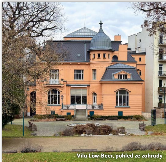
Vila Löw-Beer, pohled ze zahrady

Součástí naší exkurze byly komentované prohlídky Arnoldovy vily a vily Löw-Beer, během kterých jsme se dozvěděli nejenom plno historických souvislostí a zajímavostí, ale obě prohlídky akcen-