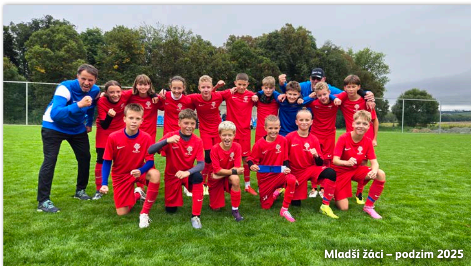
Mladší žáci – podzim 2025

Tyto činnosti jsme rozvíjeli formou jak drilových cvičení, tak hlavně v malých a velkých hrách.