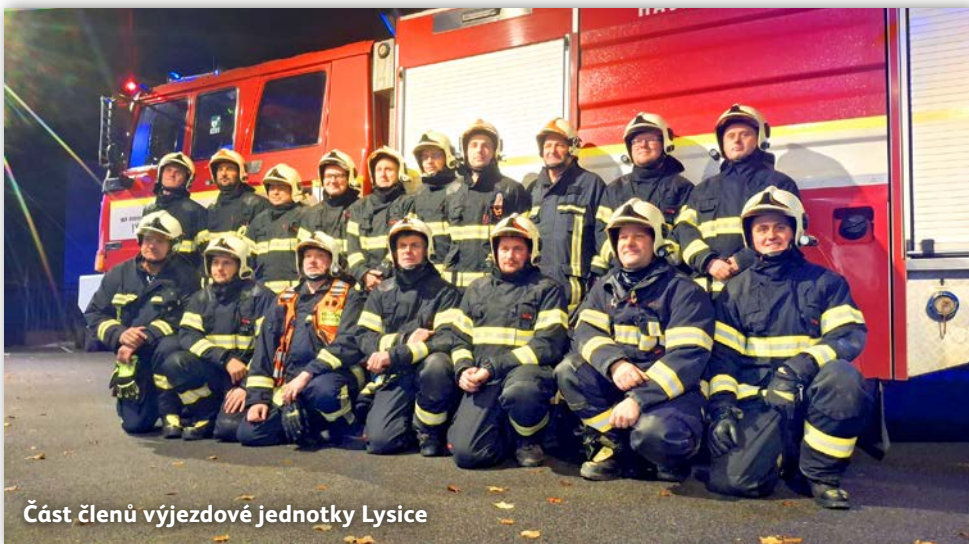
Část členů výjezdové jednotky Lysice

ky a výstroje. Pravidelně jsme se s ostatními jednotkami účastnili cvičení pořádaných HZS, abychom i přes menší množství zásahů zůstali v kondici a připraveni na cokoliv.