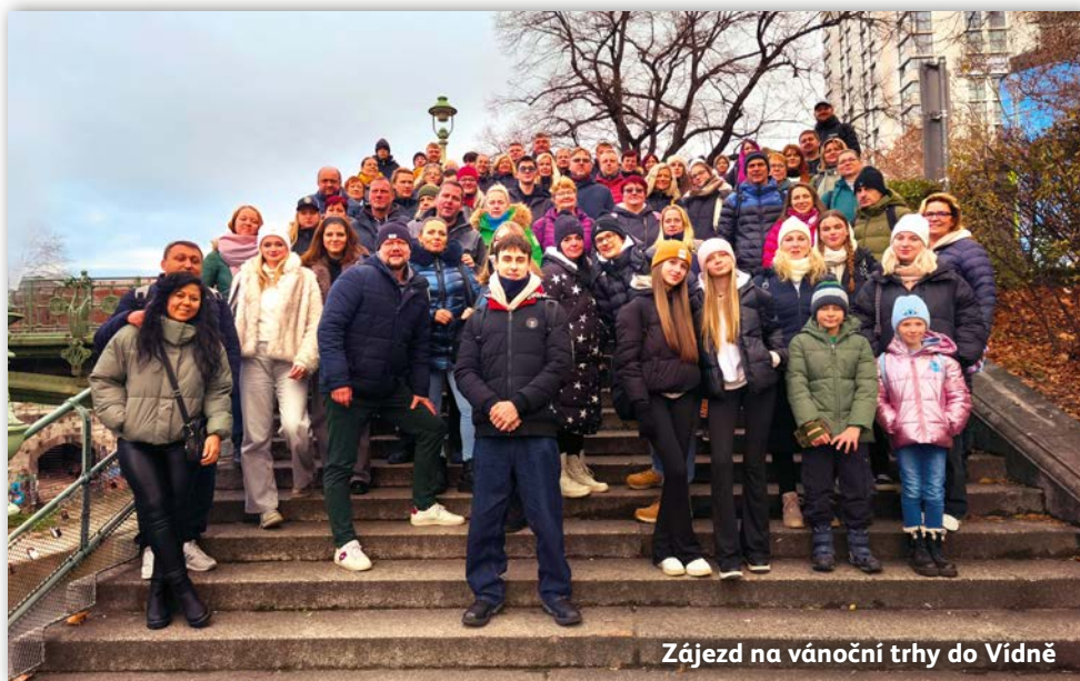
Zájezd na vánoční trhy do Vídně