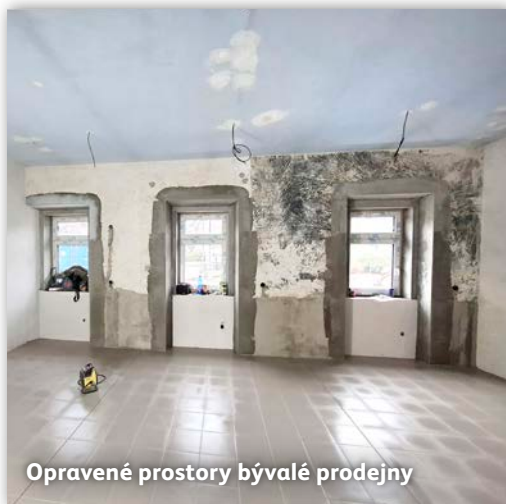
Opravené prostory bývalé prodejny

Asi jste si všimli, milí spoluobčané, že intenzivně pokračují stavební úpravy budovy pošty, kterými vznikne prostor pro dětskou skupinu. Přestože od Mini-