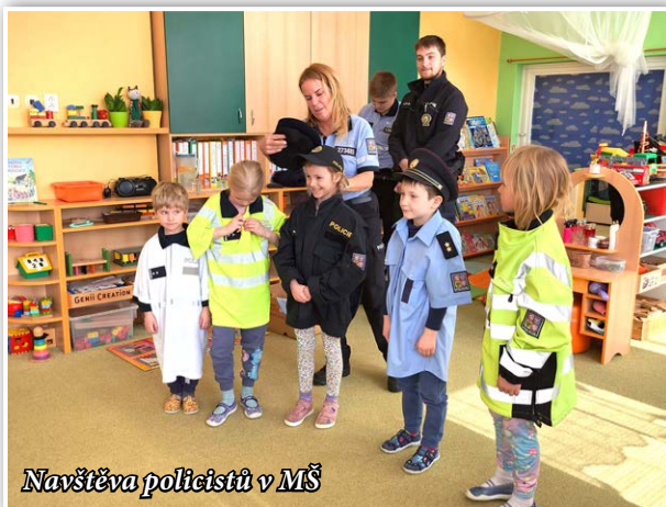
Navštěva policistů v MŠ

V květnu děti všech tříd připravily pro své maminky oslavu Dne matek, která byla letos hodně netradiční. Kromě krátkého programu a dárečků děti nachystaly ve třídách pro maminky wellness procedury. V masážním koutku jim poskytly masáž celého těla pomocí různých technik a přístrojů, v kadeřnictví je učesaly, na kosmetice si maminky užily různé pleťové masky a líčení, v nehtovém studiu se jim děti postaraly o masáž rukou a nalíčily jim nehty..., v korálkárně děti pro maminky vyrobily náramek nebo v mýdlovém studiu voňavé mýdlo. Nechyběla aromaterapie, muzikoterapie a kavárnička, ve které děti maminkám nachystaly občerstvení. Na závěr společně zavítali do fotokoutku, kde se na památku vyfotili. Strávili jsme společně příjemné odpoledne, plné dojemných okamžiků.