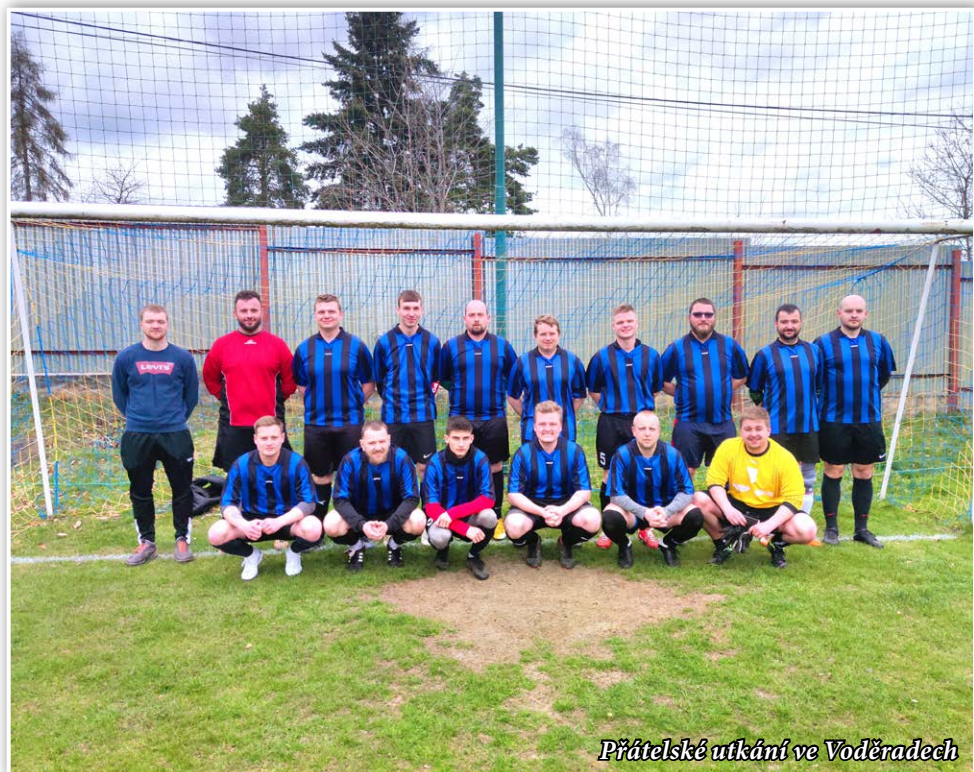
Přátelské utkání ve Voděradech