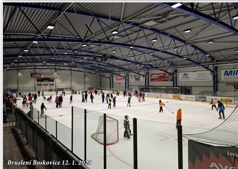
Bruslení Boskovice 12. 1. 2025

Zde jedna technická připomínka/vysvětlení. V loňském lednu se po několika letech, především díky členům SDH Lysice a vhodným klimatickým podmínkám, podařilo vyrobít ledovou plochu na lysickém „zimáku“. Jistě jste si tedy kladli otázku při mrazivém počasí v letošním únoru – proč se nepracuje na stříkání kluzišť v Lysicích? Odpověď je, že by led i při minusových teplotách ve stínu kvůli slunci, které je okolo poledne v únoru již dost vysoko, roztál a otekl. Možnost zhotovit bezpečný a kvalitní led je proto na lysickém kluzišti jen do konce ledna.