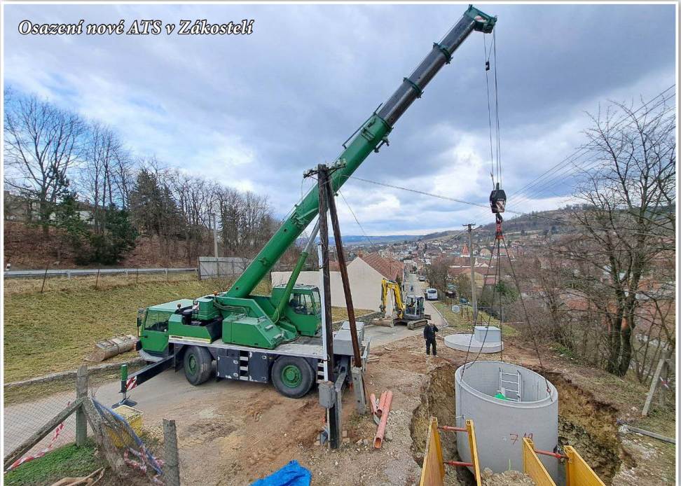
Osazení nové ATS v Zákostelí

s probouzejícím se jarem se rozbíhají i stavební práce a jiné aktivity v našem městečku. Stavba vodovodu Marek se již blíží do finále. Termín ukončení stavby stanoví smlouva na 20. května 2025. Oproti tomuto termínu se zřejmě zpozdí výstavba vyhlídky na vodojemu na Marku, se kterou původně projekt nepočítal. Dokončení vyhlídky však nebude mít vliv na spuštění celé stavby do provozu.