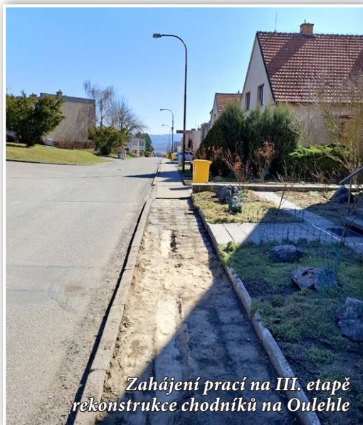
Zahájení prací na III. etapě rekonstrukce chodníků na Oulehle

V únoru proběhlo výběrové řízení na třetí etapu rekonstrukce chodníků na Oulehle. Tentokrát jde o úsek od autobusové zastávky na Jáně až po ulici Pod Hvozdcem. Rozpočtová cena opravy uvedeného úseku byla 3.775.948 Kč bez DPH. O realizaci této veřejné zakázky projevilo zájem 6 stavebních firem. Nejvýhodnější nabídku zaslala společnost TVM stavby s. r. o., Předklášteří, která již prováděla první etapu a která práce provede za cenu 2.138.518,27 Kč bez DPH.