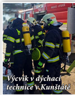
Výcvik v dýchací technice v Kunštátě

ravském kraji, aby v případě neštěstí s velkým počtem zraněných byla na místo vyslána právě jedna z takto předurčených jednotek, která na místo doveze potřebné vybavení a zázemí pro základní ošetření většího počtu osob. Se zaměřením na tento druh události proběhl i společný výcvik, kterého se účastnili ZZS, HZS, Policie ČR a naše jednotka. Tématem výcviku byl řidič, který najel do davu lidí, a na místě se nacházelo přes 30 zraněných. Veškerá zranění byla namaskována pro autentičnost a výcvik probíhal tak, jako by se jednalo o reálnou událost. Družstva hasičů a záchranářů přijížděla postupně a plnění úkolů kontrolovali vedoucí z každé složky IZS.