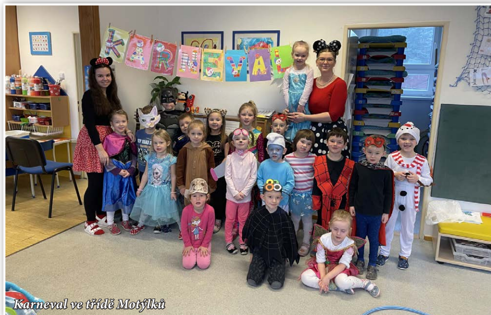
Karneval ve třídě Motýlky

mínky pro to, aby se mohly samy realizovat, aby se naučily pracovat s tělovýchovnými pomůckami a pohyb byl pro ně radostí a zábavou. Jednou týdně máme možnost navštěvovat s dětmi tělocvičnu, kde vedeme děti k všestranným pohybovým dovednostem.