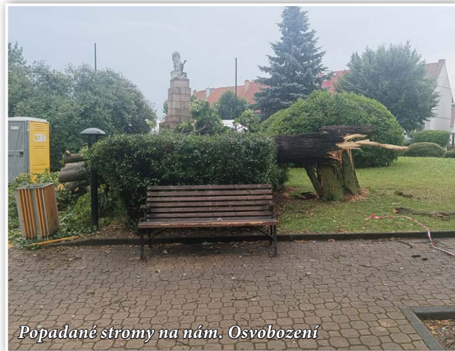
Popadané stromy na nám. Osvobození

Jistě si, milí spoluobčané, vzpomínáte na letní bouři, která naše městečko postihla v loňském roce o pouťové neděli 30. června odpoledne. Silný vítr způsobil pád vzrostlé lípy na náměstí Osvobození a několik dalších stromů spadlo i v oboře. Jen shodou šťastných okolností se tehdy nikomu nic nestalo. Přestože stromy v oboře, ale i jinde v obci, byly již v minulosti, a to