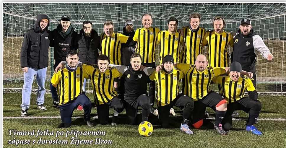
Týmová fotka po přípravném zápase s dorostem Žijeme Hrou