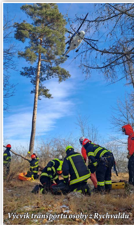
Výcvik transportu osoby z Rychvaldu

Skvělou příležitostí jak se blíže seznámit s náročnou prací hasičů může být Den otevřených dveří profesionálních hasičů. Uskuteční se v sobotu 26. dubna od 9:00 do 14:00 na CHS Blansko, HS Boskovice a HS Kunštát. Ke zhlédnutí bude zajímavý preventivní program pro děti i dospělé.