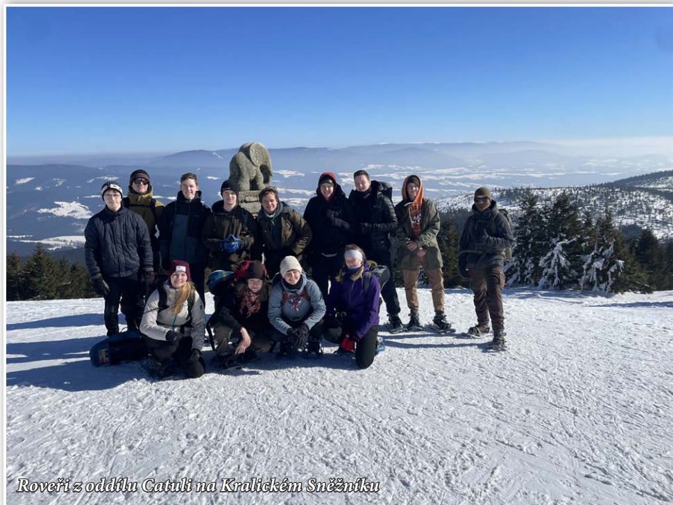
Roveři z oddílu Catuli na Kralickém Sněžníku

Na konci února se do Jeseníků podívali i roveři, kteří tam společně strávili jeden víkend. Co se týče sněhu, měli větší štěstí než skauti a skautky z Corleonusu. Roveři na své expedici využili sněžnice, ale i lopaty na sníh, které jim urychlily sestup z Kralického Sněžníku, jelikož se téměř celou zpáteční cestu klouzali.