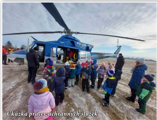
Ukázka práce záchranných složek

Díky paní kastelánce jsme navštívili před Vánocemi nádherně vyzdobený zámek a také si užili prohlídku oranžerie se 120 let starými stromy kamélie japonské a sbírku citrusů ve skleníku.