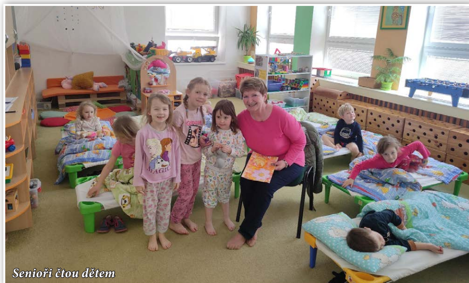
Senioři čtou dětem