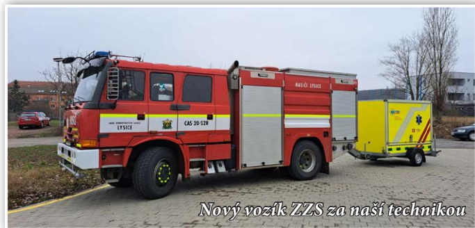
Nový vozík ZZS za naší techniku