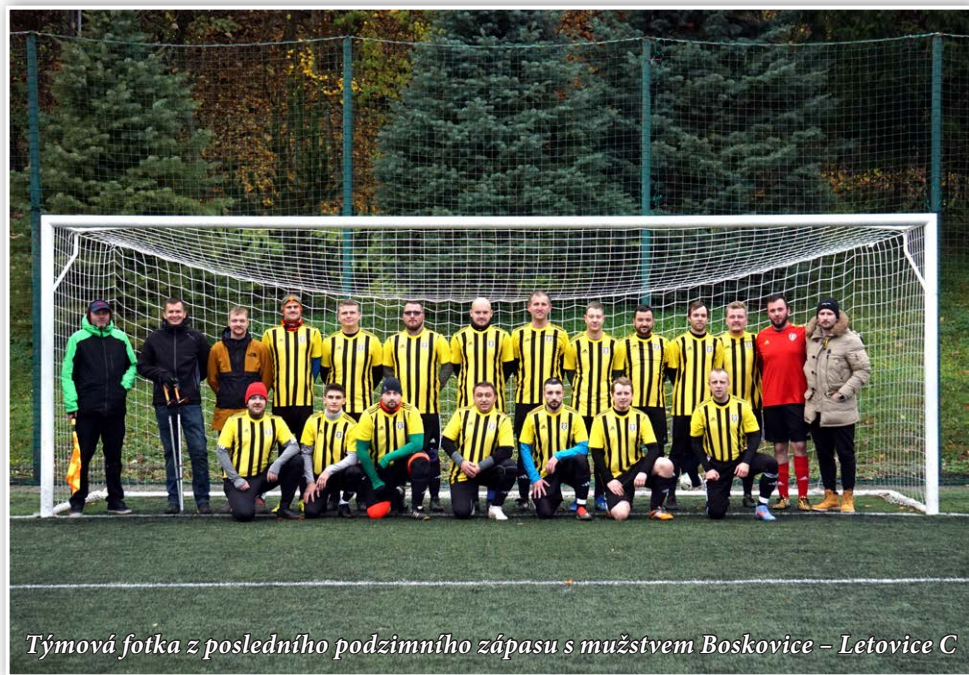
Týmová fotka z posledního podzimního zápasu s mužstvem Boskovice – Letovice C

brankami. Nicméně vymlouvat se nechceme a nebudeme. A přestože s věkovým průměrem týmu necelých 31 let to už tak jednoduché nebude, fyzickou a celkově výkony týmu je třeba zlepšit.