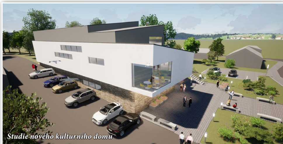
Studie nového kulturního domu

tzv. dětské skupiny, což je název pro specifickou formu péče o děti ve věku od 6 měsíců do zahájení povinné školní docházky, a jde v podstatě o méně formální alternativu jeslí a mateřské školy. Lysická mateřská škola každý rok z kapacitních důvodů odmítá přijetí dětí z okolních obcí, děti mladší tří let nejsou do školky přijímány vůbec. Lysických se to zatím nedotklo, ale i to se může v budoucnu změnit, a proto městys zvažuje přestavbu druhého patra budovy pošty na prostor umožňující provozování dětské skupiny. Státní dotace na tyto úpravy jsou až do výše 100 % uznatelných nákladů, maximálně 25 milionů korun. Případně získaná dotace by tak alespoň částečně pomohla vyřešit nezbytnou rekonstrukci budovy a obci by ušetřila nemalé finanční prostředky. Současně by pomohla i rodinám s malými dětmi z Lysic i okolí s jejich umístěním do předškolního zařízení.