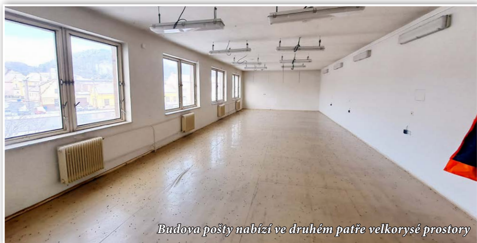
Budova pošty nabízí ve druhém patře velkorysé prostory

Od letošního 20. listopadu je městys Lysice vlastníkem budovy pošty, kterou koupil za cenu 4.900.000 Kč od České pošty s. p. Vzhledem k tomu, že je budova téměř v původním stavu, zejména pak prostory ve druhém patře, které pošta sama nikdy nevyužívala, bude nutné uvažovat alespoň o částečné rekonstrukci spočívající ve výměně oken, zateplení venkovního pláště, úpravě vytápění atd. V současné době stát dotačně podporuje zřízení