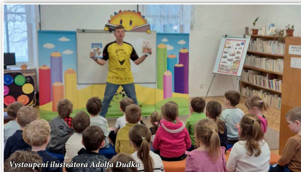
Vystoupení ilustrátora Adolfa Dudka

Stalo se již tradicí, že jsou na konec školního roku do knihovny zváni prvňáčci. Na prvním setkání v květnu se seznámili s jejím prostředím a vhodnou a zajímavou nabídkou knih, které už si sami mohou číst. Přečetli jsme si příběh z písmenkové školy a děti měly možnost se aktivně zapojit.