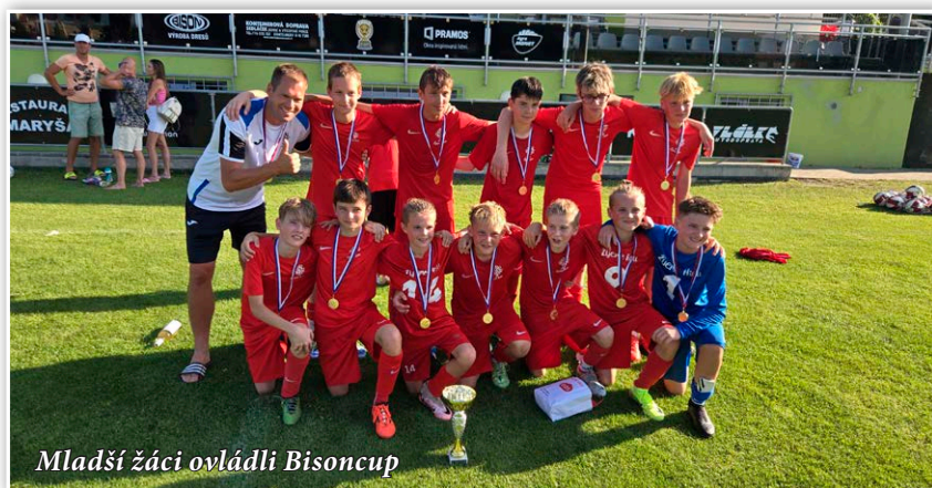
Mladší žáci ovládli Bisoncup