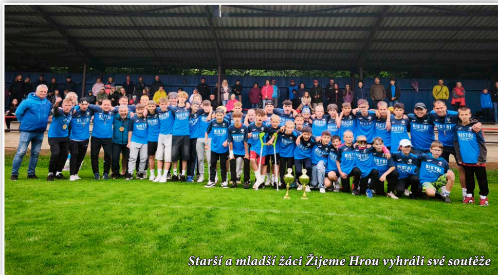
Starší a mladší žáci Žijeme Hrou vyhráli své soutěže

Díky trpělivé a koncepční práci s dětmi v našem regionu se podařilo nabudovat širokou základnu plnou talentovaných mladých fotbalistů. Počtově i kvalitativně nám na sebe navazují ročníky hráčů 2010–2018. Od nové sezóny budou naši mládežnickou vlajkovou lodí žakovské týmy Žijeme Hrou v nejvyšší krajské soutěži.