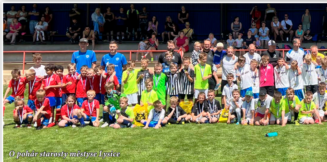
O pohár starosty městyse Lysice

V neděli 15. června sehrály v Kunštátě týmy ŽH U7 a U8 přátelské utkání proti Fotbalové škole Třebíč U7 a U8 . Dva kluby, které vyznávají velmi podobnou filozofii výchovy dětí, a vypadá to, že o budoucí fotbalové talenty zde nebude nouze. Parádní fotbalové dopoledne. Děkujeme FŠ Třebíč za skvělý sparring a určitě brzy zopakujeme.