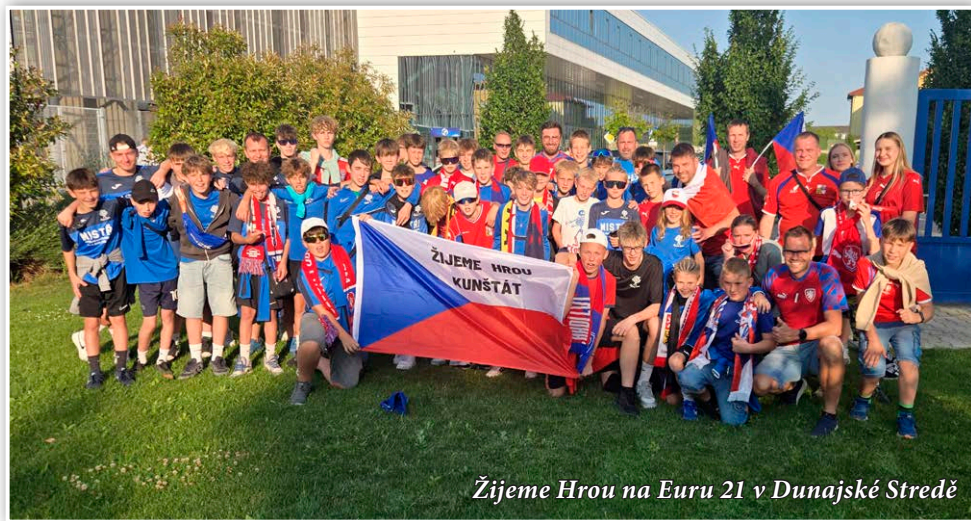
Žijeme Hrou na Euru 21 v Dunajské Stredě

Ač čeští fotbalisté do 21 let v prvním utkání na letošním evropském šampionátu podlehli obhájcům z Anglie 1:3, tak to byl pro všechny parádní fotbalový zážitek. Naši žáci si užili nejen samotný fotbalový zápas, ale celý doprovodný program, včetně povzbuzování českých fanoušků ve městě před zápasem. Atmosféra Eura 21 všechny doslova pohltila.