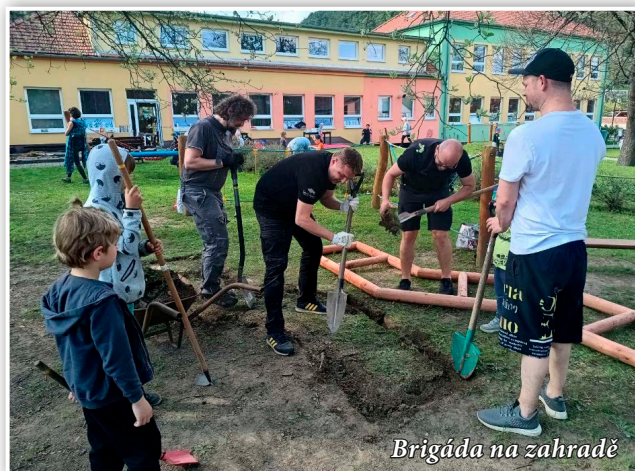
Brigáda na zahradě

Ve středu 23. 4. 2025 v odpoledních hodinách se u příležitosti Dne Země uskutečnila na zahradě Mateřské školy brigáda, která se těšila vysoké účasti rodičů i dětí.