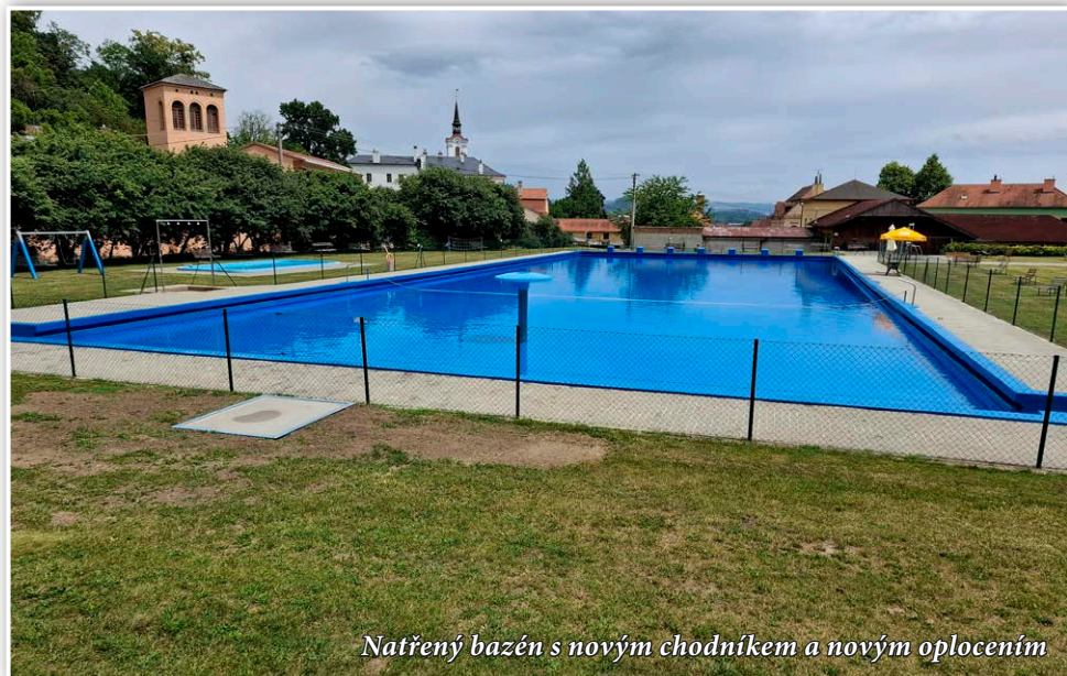
Natřený bazén s novým chodníkem a novým oplocením

V minulých vydáních Lysického zpravodaje jsem Vás, vážení spoluobčané, informoval o záměru městyse zřídit v budově pošty dětskou skupinu pro 20 dětí, a s tím souvisejícími nutnými stavebními úpravami části budovy. Žádost o dotaci byla podána už v říjnu minulého roku, ale do okamžiku uzávěrky tohoto zpravodaje Ministerstvo práce a sociálních věcí o poskytnutí dotace nerozhodlo, takže nezbývá, než čekat. Městys je na realizaci připraven – výběrové řízení na zhotovitele máme uzavřeno a ten je připraven práce okamžitě zahájit. Bez zajištěného financování se ale do takto nákladné stavby (v hodnotě cca 16 milionů Kč) pustit nemůžeme. Podle neoficiálních informací bychom dotaci obdržet měli. Situaci ztěžuje i skutečnost, že konečný termín pro zprovoznění dětské skupiny je stanoven na 30. dubna 2026.