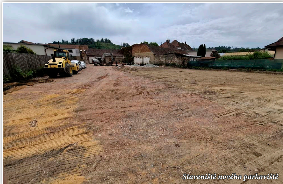
Staveniště nového parkoviště

V souvislosti s těmito stavebními úpravami dojde k dočasnému omezení pěšího provozu v okolí zastávek a samotné zastávky budou po dobu výstavby přemístěny na náměstí Osvobození. Prosíme občany o pochopení a trpělivost. Po dokončení stavby získáme důležitý prvek dopravní infrastruktury s výrazným zlepšením komfortu pro cestující i motoristy.