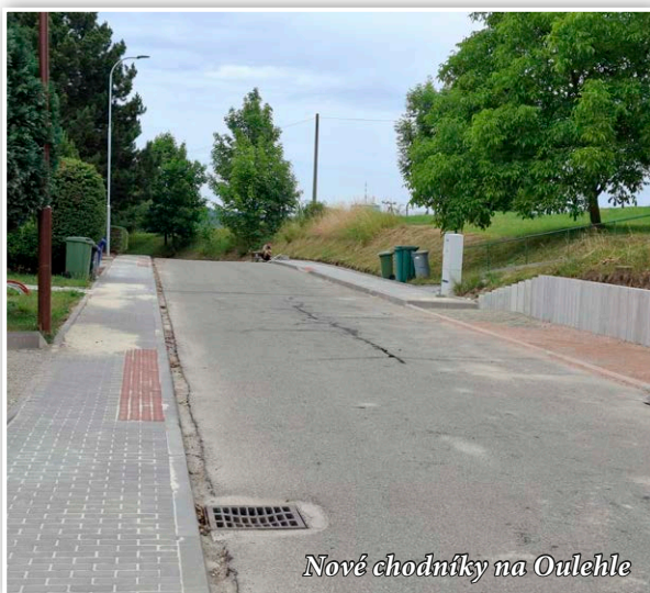
Nové chodníky na Oulehle