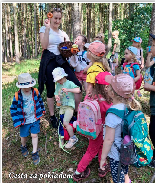
Cesta za pokladem