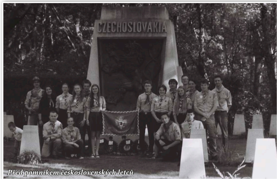
Před pomníkem československých letců

První den po příletu jsme celý věnovali prozkoumávání Londýna. Prošli jsme Hyde Park, viděli Big Ben, Tower Bridge a mnoho dalšího.